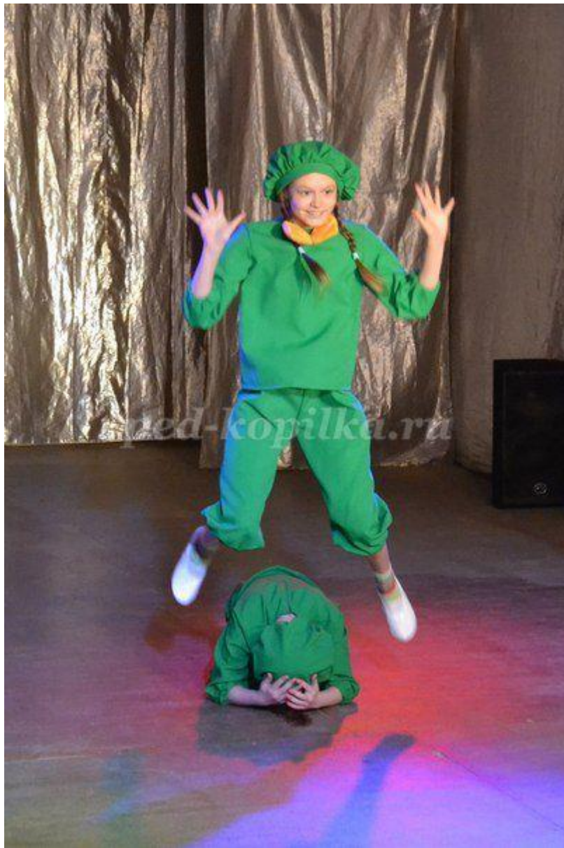
Все Лягушки (хором). Жила-была на свете лягушка-квакушка.